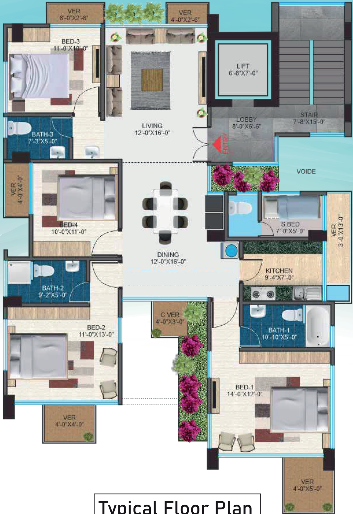
Typical Floor Plan